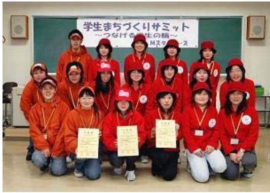
写真 5-3 調印式②(他団体との交流)