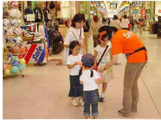
写真 2-2 折り紙の配布