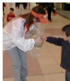
活動中のメンバー

TEL 089-998-3533 E-mail mcube_msta@mail.goo.ne.jp URL http://home.e-catv.ne.jp/oidenka/M/index.htm