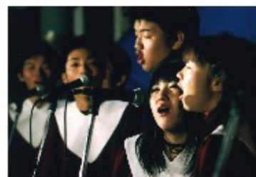
聖書ゴスペル研究会の皆さん

銀天街で『X'mas Street 2003』を開催しました。Mスターターズと商店街の人々が協力してひとつのものを作り上げることにより、交流を深めていき、買い物に来られるお客様にクリスマスの雰囲気を楽しんでもらい、商店街の活性化につなげることができ、このイベントをとおして商店街の人々とお客様に、素敵なクリスマスをお届けすることが出来ました。