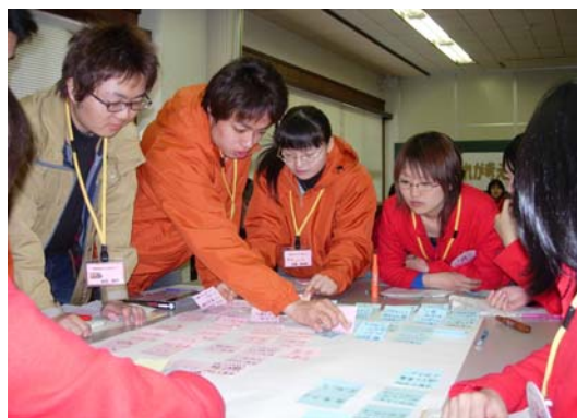
写真 5-2 意見交換②