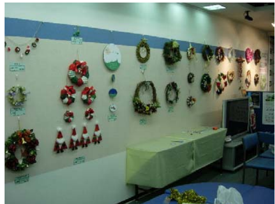
写真 4-2 リースコンテスト