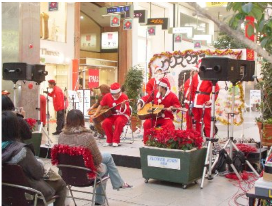
写真 4-1 クリスマスコンサート

今回のイベントの目的は、「来街者にクリスマスの雰囲気を楽しんでもらうこと」「イベントを開催するにあたり、Mスタと商店街の人々が協力してひとつのものを作り上げるという過程の中で、お互いの交流を深めていきたい」、この2点であった。今回このイベント全体を通して、商店街の広範囲で多くの来街者を楽しんでもらえたようだ。サンタクロースの衣装で折り紙を配っているとき、またイベントの運営上アーケード内を行ったり来たりしているときなど、来街者がツリーやサンタ、手作りリースを見て楽しそうにしている姿が多くみられた。商店街の方とのかかわりは、どのように関わっていけばいいのか分からずお互い手探り状態ではあったが、中には積極的に連絡を取り合ってください方、また「困ったことがあったら言って」と力強い言葉をくださった方もおられ、これからの活動につながる基盤づくりができたと思っている。また、このようなイベントを継続して行っていくことで、もっとたくさんの商店街の方々と交流を図って、「商店街でイベントをすることの意味」をもっと明確にしていきたい、と考えている。