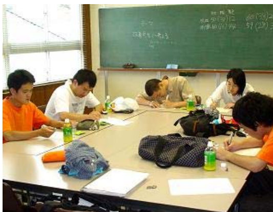
写真 2-5 日報の作成