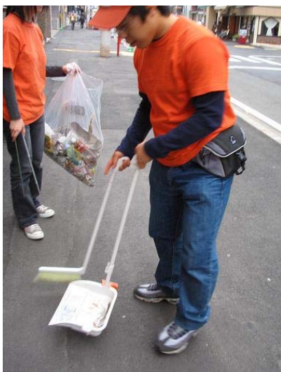
写真 2-3 美化活動