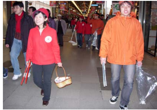
写真 5-4 合同活動