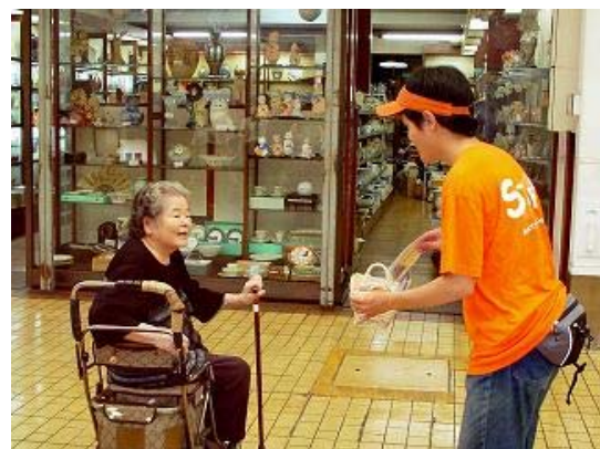
写真 2-4 お年寄りのエスコート (地元住民との交流)