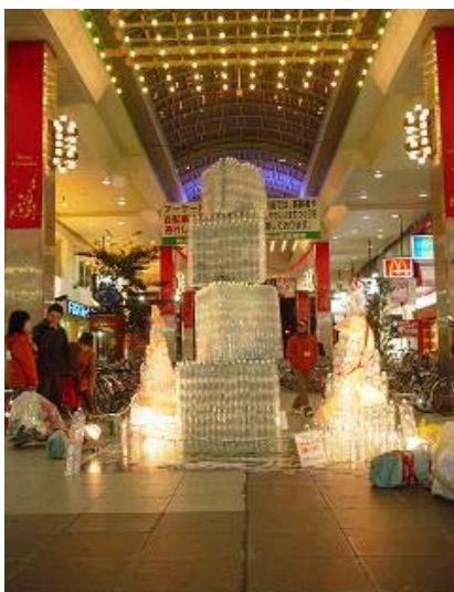
写真 4-3 ペットボトルツリー