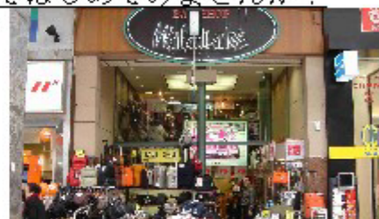
ワタナベカバン店

営業時間 10:00~19:30 定休日 水曜日(不定休) TEL・FAX 089-921-3821