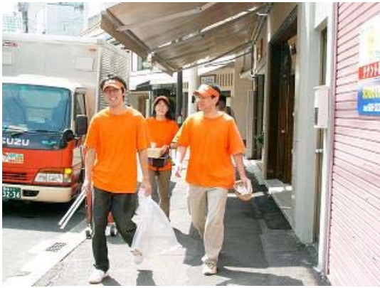
写真 2-1 挨拶活動