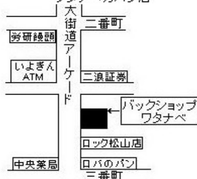
Map (バックショップワタナベ)