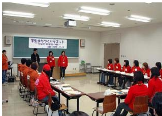
写真 5-1 意見交換①

このサミットで、「通常活動、イベントなど形態を問わず、お互いの活動について報告・活動・連絡を行っていく」、「相互リンクを張り、ウェブ上で簡単に行き来できるようにする」という内容の共同宣言の同意書をまとめ、調印した。(写真5-3)