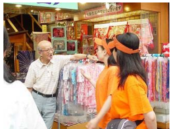
写真 2-6 商店の人との交流