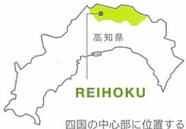
四国の中心部に位置する高知県嶺北。緑に囲まれた自然豊かな地域です。