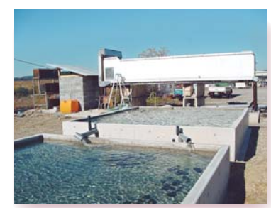
スジアオノリ陸上養殖実験