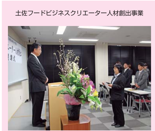
土佐フードビジネスクリエーター人材創出事業