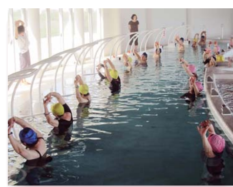
室戸市健康増進事業