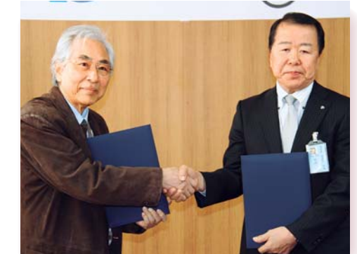
芸西村との連携協定締結