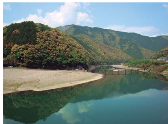
四万十川環境保全