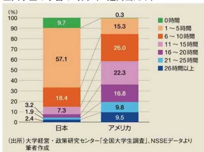
■大学生の学習の時間（1週間当たり）