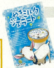
やぎミルクジェラート