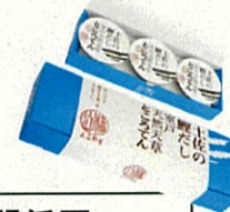
土佐の鑑だし 室戸天然天草ところてん