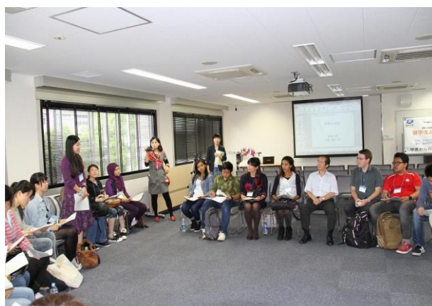
学長と留学生の懇談