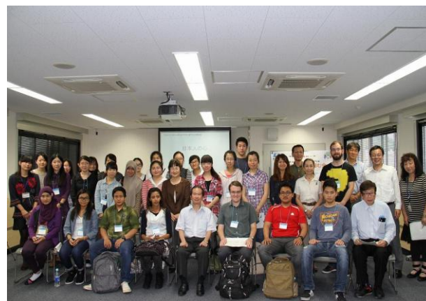
学長と留学生による集合写真