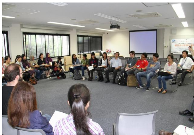
学長と留学生の懇談