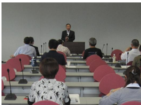
開催地挨拶(高知県水産振興部 東部長)

漁業者、食品業者、役場職員、さらに一般の方含め、約 80 名の参加者となり、セミナー後の交流会ともあわせ、活発な情報交換が行われました。多くのメディアにも取り上げていただき、高知におけるカツオに対する関心の高さを改めて感じました。