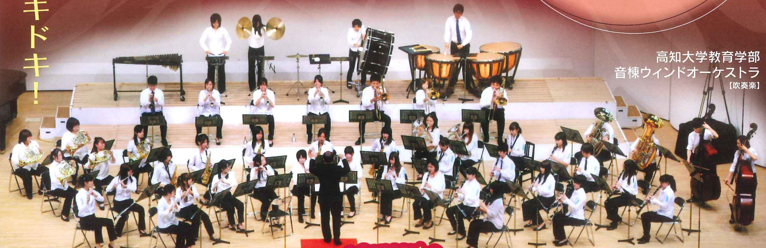
高知大学教育学部 音棟ウィンドオーケストラ 【吹奏楽】

プレイガイド 高知県民文化ホール 088-824-5321 高知プレイガイド 088-825-4335 高知市文化プラザ 088-883-5052 高知大丸プレイガイド 088-825-2191 DUKE SHOP 高知 088-825-2505