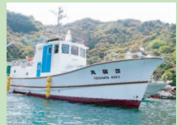
調査実習船「豊旗丸」