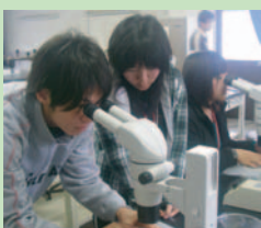
実習風景 (顕微鏡観察)

実施要項はホームページ( http://www.kochi-u.ac.jp/kaiyo/ )に掲載されています