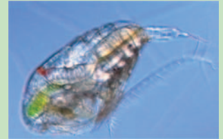
プランクトン(カイアシ類)

教室からフィールドに出て普段見ることのない海の生物を採集し、調べてみませんか。きっと新しい発見や驚きがあります。