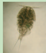
メイオベントス(カイアシ類)