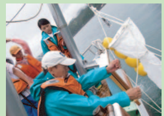
実習風景 (プランクトン採集)