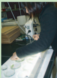
実習風景 (海藻の培養実験)