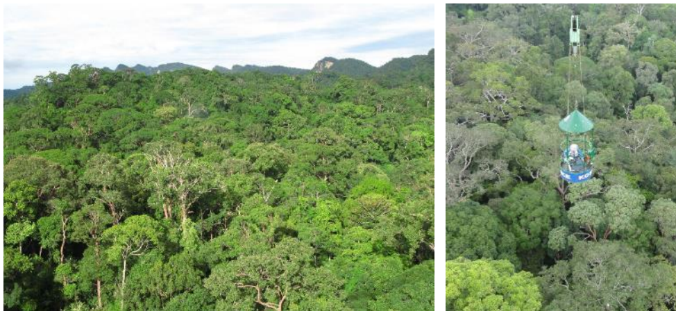
図 1. マレーシアの熱帯林（左）と林冠クレーンのゴンドラ（右） マレーシアなどの熱帯林は、樹高が 50m を超える多種多様な巨大な樹木で覆われています（左）。高さ 90m の林冠観察用クレーンのゴンドラに乗り、樹高 50m を超える林冠木の葉にアクセスして、光合成を測定しています（右）。